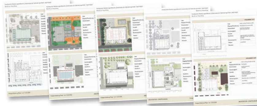
Vorprüfbericht: Phase 1

Ziel des Wettbewerbs ist die Erlangung von qualitätsvollen Entwürfen für den Ersatzneubau der Südtondernsporthalle der Stadt Niebüll.