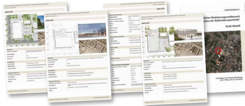
Vorprüfbericht: Phase 2