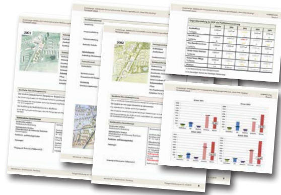
Vorprüfbericht Phase 2