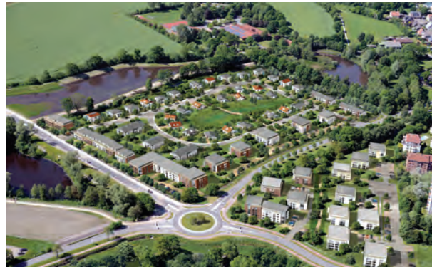
Visualisierung, Gisbert K. Jungermann Architekturillustrationen