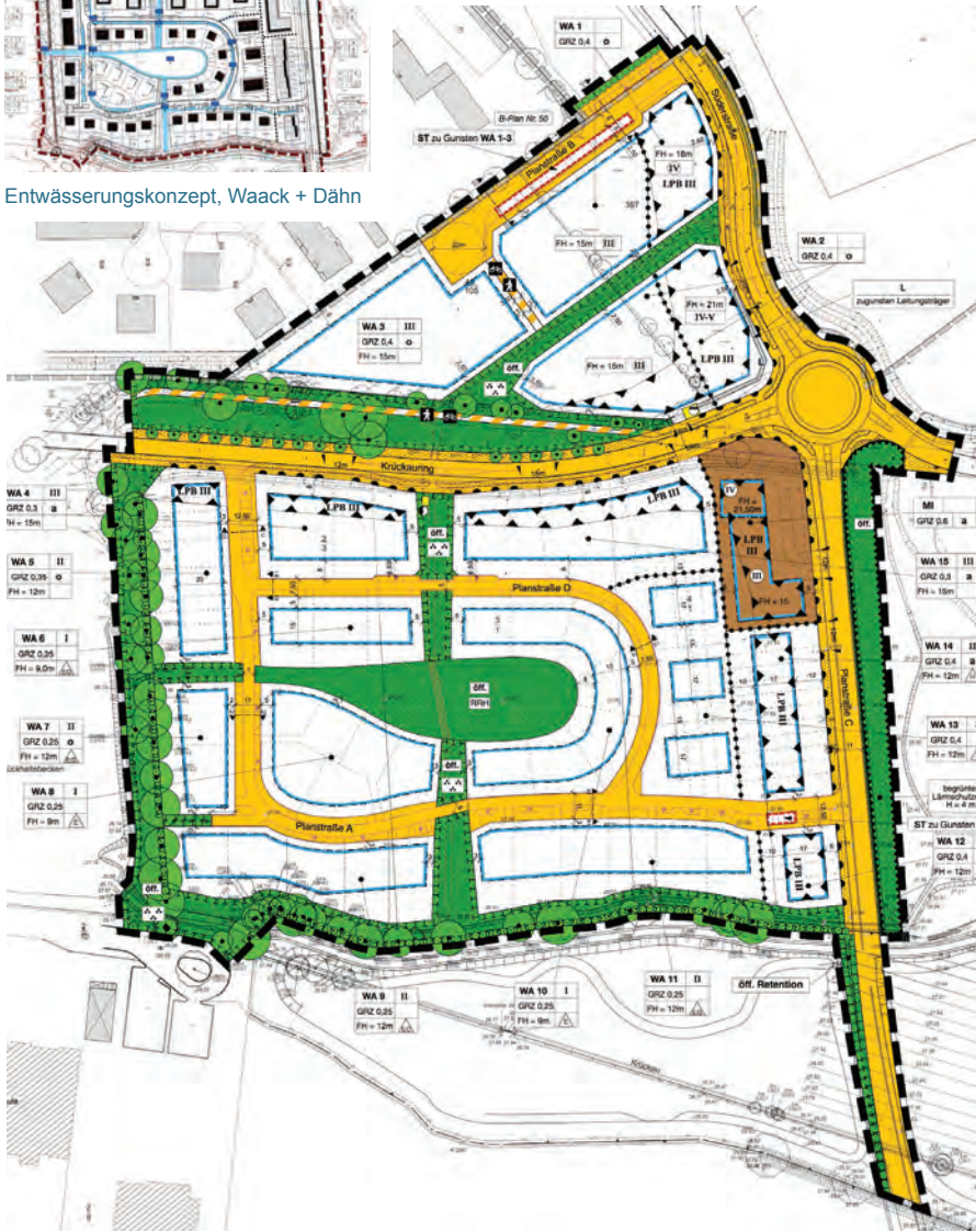
Bebauungsplan, erneute Auslegung, A+S