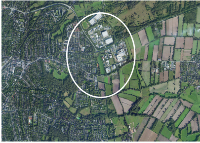
Luftbild mit Verortung