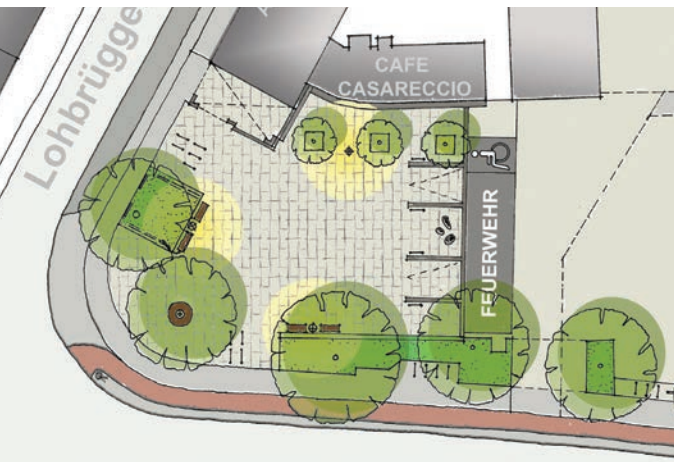
Umgestaltung Lohbrügger Markt (A+S)