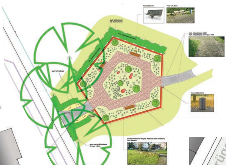
Gestaltungsplan Leuschnerpark (GSP)