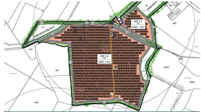
Ausschnitt Modulplan zum Bebauungsplan Nr. 52, Teilbereich I