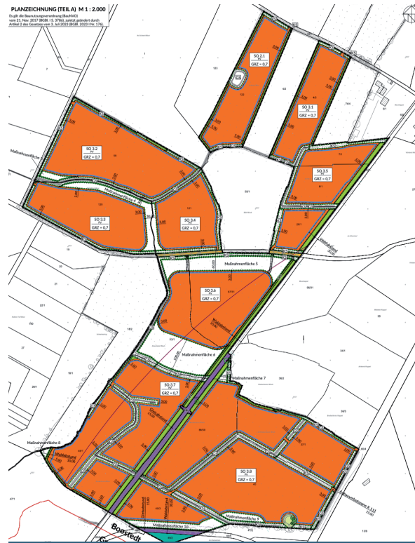
Bebauungsplan Nr. 52, Teilbereich II und III (Vorentwurf), Planzeichnung