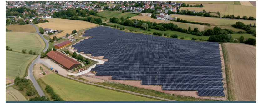
Beispiel PV-Anlage Untersiemau