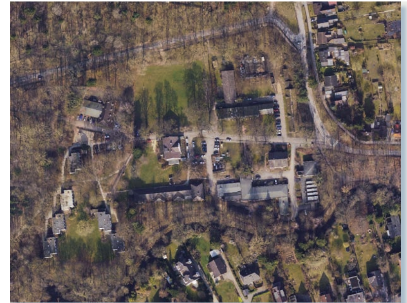
Luftbild (Landeshauptstadt Kiel)