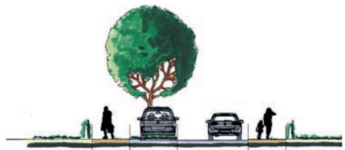
Privatgrundstücke Gehweg Grün- und Parkstreifen Fahrbahn Gehweg Privatgrundst